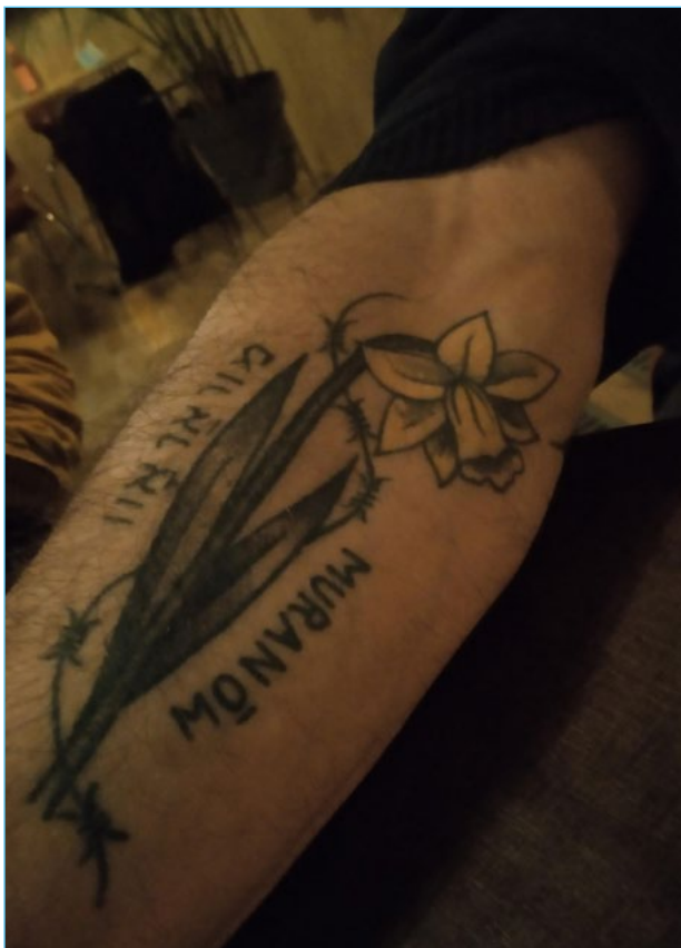
10. To jest żonkil. Napisane jest tu Muranów. I Muranów w Jidysz. To upamiętnienie Powstania w getcie. Jestem z tej dzielnicy i utożsamiam się z jej historią. To było ważne wydarzenie i kompletnie zmieniło jej kształt. I wpłynęło na dalsze jej losy.