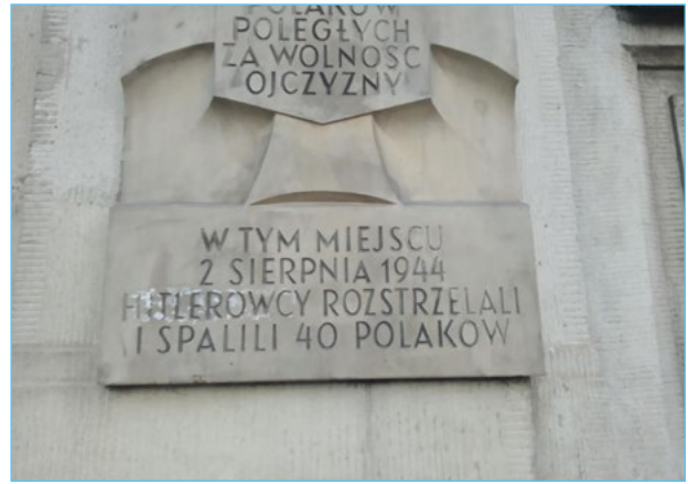
5. Tablice z ulicy Rakowieckiej 61. Widoczne pozostałości po kartkach z napisem zasłaniającym napis „hitlerowcy”. Według informatorów na kartkach był napis „Niemcy”.