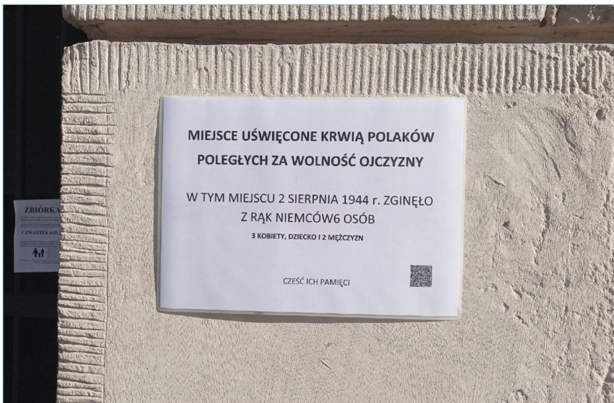
7. Kartka zawieszona przy ul. Rakowieckiej 5 w dniu 1 sierpnia 2020.

Najwięcej palących się świec pojawiło się przy tablicach i miejscach pamięci w dniu 1 sierpnia. Obok niewielkich wieńców z żółto-czerwonymi barwami miasta (przekazanymi przez władze miasta) i zniczy ustawionych przez Kancelarię Prezesa Rady Ministrów stały dziesiątki świec przyniesionych przez mieszkańców. W dwóch kluczowych miejscach, tj. w parku Morskie Oko i w parku Dreszera, gdzie odbywały się uroczyste obchody z udziałem władz dzielnicy, mieszkańcy przynosili najczęściej świec i kwiatów. Przez cały dzień przychodzili tam ludzie (także przyjeżdżając z innych części miasta), żeby zostawić znicze, a także robić zdjęcia. Warto odnotować, że niektóre lampiony ustawione przez Kancelarię Premiera (duże, z charakterystyczną naklejką) były używane do listopada, ponieważ ktoś wymieniał w nich wkłady.