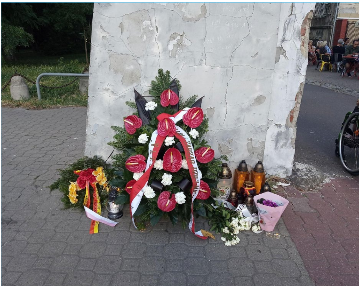
9. Kwiaty złożone przez urzędników, w imieniu Prezydenta Miasta oraz władz Dzielnicy Mokotów, pod Domkiem Gotyckim w dniu 1 sierpnia 2020.