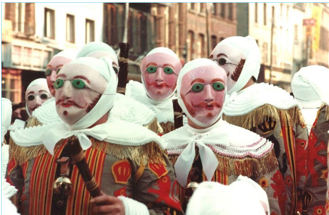
1. Karnawał w Binche.