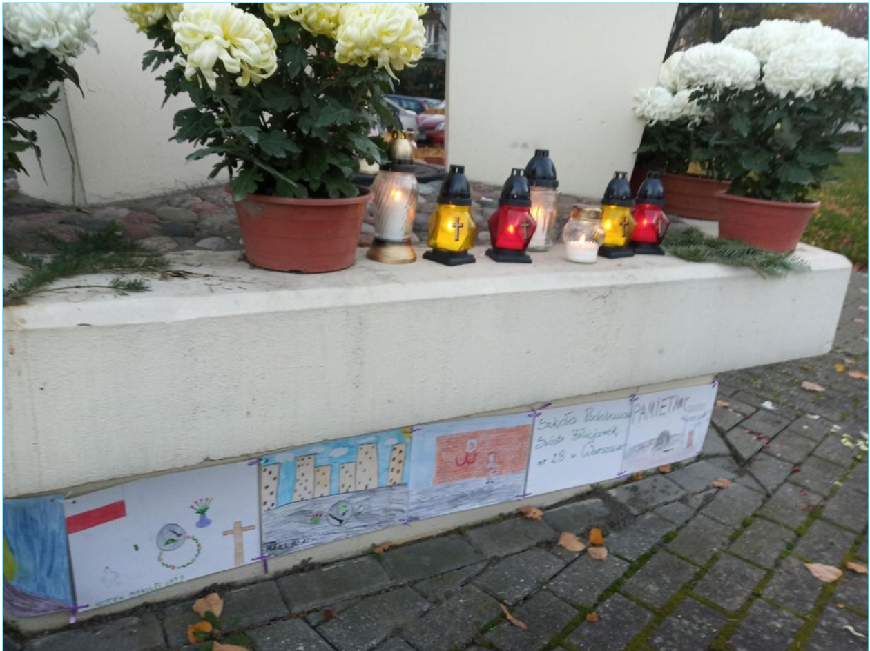
8. Pomnik Pamięci Żołnierzy AK Powstańców Mokotowa pomordowanych przez hitlerowców już po kapitulacji 27 września 1944 w parku Morskie Oko (ul. Dworkowa). Zdjęcie wykonane 1 listopada 2020.

wniosek do budżetu obywatelskiego i figurowały jako jego autorki 25 . Niemniej osobą, która zabiegała o to upamiętnienie, był członek zgrupowania AK walczącego na reducie. Z podobną inicjatywą – tym razem chodziło o upamiętnienie mieszkańców Siekierok, którzy zginęli w czasie II wojny światowej – wyszła jedna z mieszkanki tego osiedla. Także ta propozycja została zrealizowana.