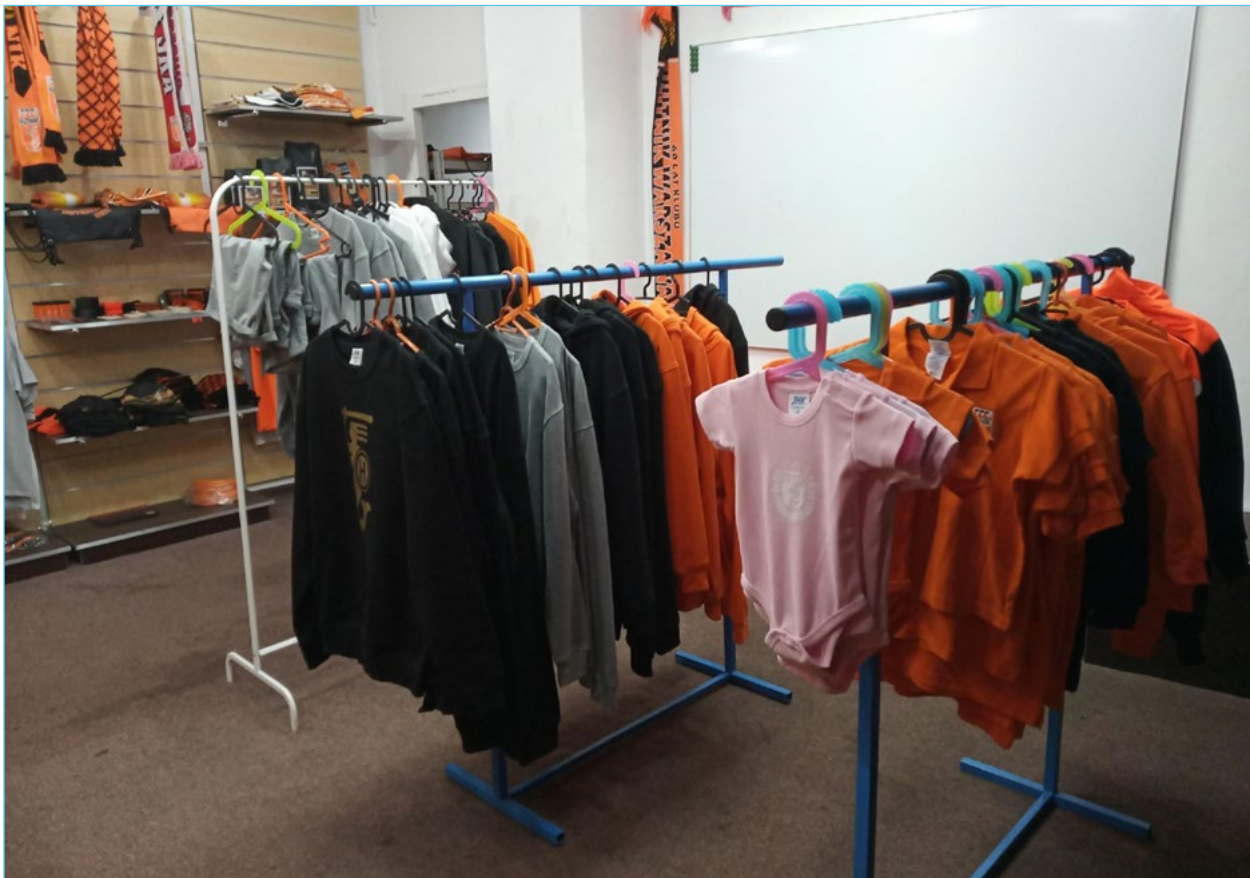
11. Wnętrze sklepu dla kibiców klubu Hutnik.

W przypadku związków z lokalnym klubem nie bez znaczenia jest budowanie wokół niego społeczności, której spójność i jednoznaczna identyfikacja wzmacniają lokalną tożsamość. Kluby tworzą własne społeczności za pomocą różnych działań. Czerpią z własnej historii oraz jej związków z dziejami i charakterem osiedla: klub Hutnik odwołuje się do powiązań z Hutą Warszawą i tradycji robotniczych; klub Sarmata do przedwojennej i powojennej historii Woli jako dzielnicy robotniczej i społeczności związanych z dużymi zakładami pracy. Kluby prowadzą akademie sportowe dla dzieci, co w założeniu także może się przekładać na silniejsze lokalne osadzenie klubu. Jak mówi jeden z rozmówców: „łatwiej się zidentyfikować z klubem, gdy gra tam zawodnik stąd – z Powiśla, z Czerniakowa. Albo w wieku 12 lat przeprowadził się, by rozwijać się w tej akademii. To dużo bardziej identyfikuje z klubem niż piłkarze kupowani i sprowadzani [...] mimo wszystko byli jakoś ukształtowani na miejscu. Poziom związania, poziom tożsamości jest inny niż w przypadku najemników. To jest fajne”. Akademie i szkoły przyciągają też na mecze rodziców i rodziny młodych zawodników. Kluby prowadzą produkcję i sprzedaż gadżetów dla kibiców (np. szaliki, koszulki, bluzy itp.; klub Hutnik ma także w asortymencie kubki, kurtki typu softshell, body dla niemowląt czy kawę „Hutnik”). Klub Hutnik prowadzi także pub pod tą samą nazwą,