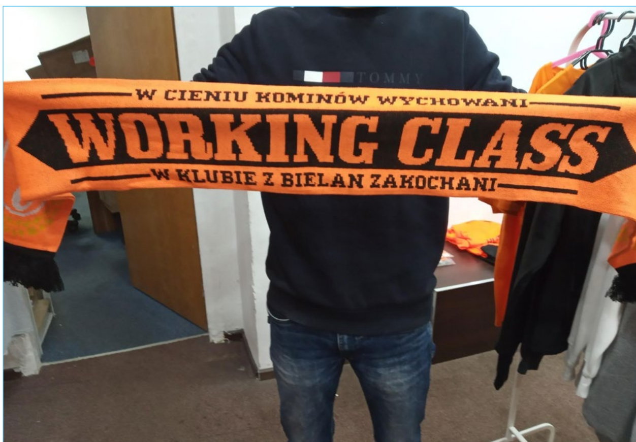
12. Szalik kibicowski klubu Hutnik Warszawa.

W kontekście aktywności sportowej nie bez znaczenia jest forma wspólnotowej czy też wspólnej praktyki oraz budowanie wokół niej pewnej społeczności, także w wymiarze tożsamościowym. Zwracali na to uwagę wszyscy informatorzy niezależnie od uprawianej dyscypliny. Stąd ważna rola klubów jako przestrzeni społecznych, w których można realizować zarówno pasje sportowe, jak i rozwijać życie towarzyskie. Mimo że zarówno kolarstwo, jak i wioślarstwo można praktykować w pojedynkę, rozmówcy zwracali uwagę na wartość wspólnej pracy, wzajemną motywację i współodpowiedzialność. Jednocześnie podkreślali, że lubią wspólnie spędzać czas