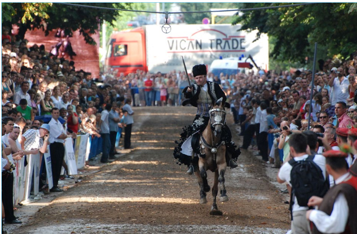
2. Sinjska Alka.

Analiza wpisów na Listę reprezentatywną UNESCO dziedzictwa niematerialnego związanego z miastami wskazuje, że tę kategorię – niematerialnego dziedzictwa miast – zdominowały kraje europejskie, na czele z Belgią, Francją i Hiszpanią.