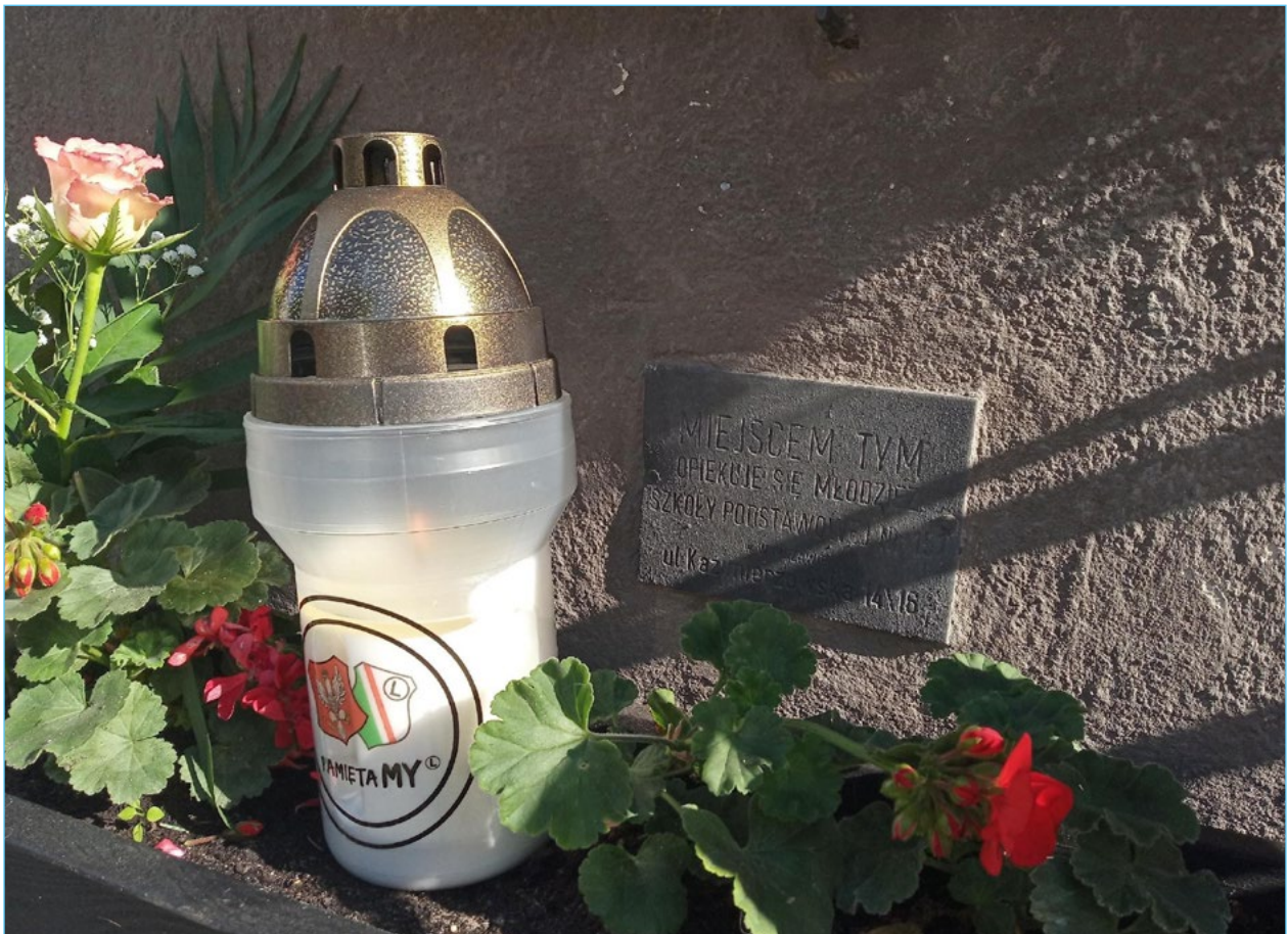
6. Świeca postawiona pod jedną z mokotowskich tablic przez kibiców Klubu Legia w dniu 1 sierpnia 2020.

W trakcie prowadzonych obserwacji zauważono, że znicze palą się nie tylko w rocznicę wybuchu Powstania Warszawskiego (co ciekawe, świece i kwiaty można znaleźć wtedy tylko przy tablicach upamiętniających Powstanie), ale także przy innych okazjach, m.in. 1 listopada czy też w okresie Wielkanocy. O ile przy niektórych tablicach pojedyncze świece pojawiają się sporadycznie, o tyle na terenie dzielnicy są też takie (np. tablica Tchorka przy ul. Olesińskiej), przy których zapalone świece stoją niemal cały czas.