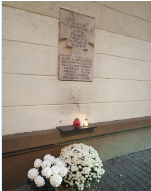
4. Tablica według projektu Karola Tchorka przy ul. Madalińskiego 39/43 w okresie Wielkanocy 2020 oraz 1 listopada 2020